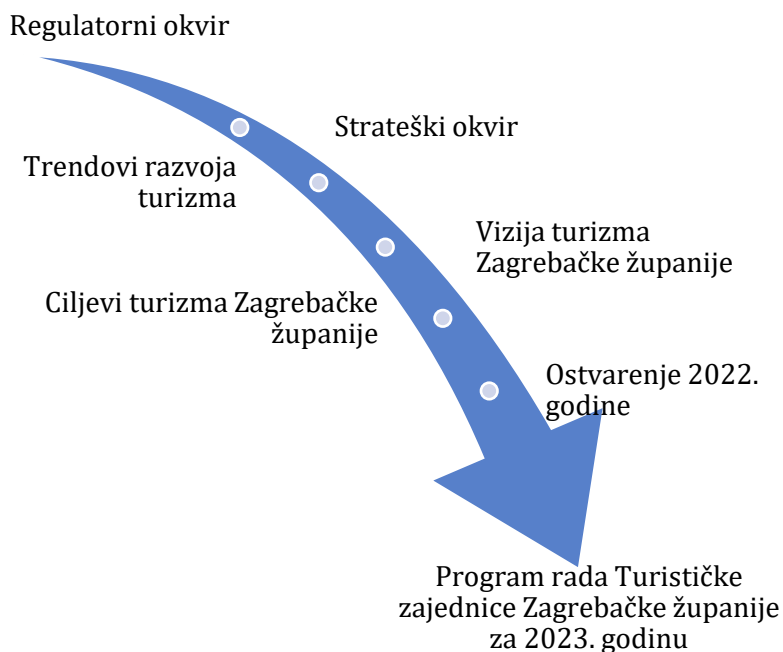
Slika 1. Polazišta Programa rada Turističke zajednice Zagrebačke županije za 2023. godinu