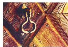
STRATEGIJA TURISTIČKOG RAZVOJA ZAGREBAČKE ŽUPANIJE

Prema članku 46. Zakona o turističkim zajednicama i promicanju hrvatskog turizma (NN 152/08), zadaća županijske turističke zajednice je, između ostaloga, izrada strategije razvoja turizma na nivou županije, te donošenje strateškoga marketinškog plana za područje županije, sukladno strateškom marketinškom planu hrvatskog turizma, stoga je TZZŽ u 2015. u suradnji s Institutom za turizam iz Zagreba izradila Strategiju turističkog razvoja Zagrebačke županije. Ovaj dokument daje jasne smjernice budućega dugoročnog tržišnog pozicioniranja, definira strateške razvojne prioritete i njihove nositelje te kreira okvir za privlačenje potencijalnih investitora te povećanje poslovnih rezultata u području turizma.